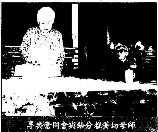
享共奮同會與給分糕蛋切母師

「地球人類的母親」，因為宇宙是無垠的，在其他的星球上必然會有與我們地球人類同樣的人，可能只是型態不同，而其來源則是一樣，是由「一位母親」所生，而「那位母親」與「地球人類的母親」是一樣的，那就是「宇宙的老母」，祂生天、生地、生萬物，不但創造有形形的宇宙，更創造無形的宇宙。有形的宇宙就是物質世界，無形的宇宙就是精神世界。因此，我們慶祝母親節，感念母親之偉大恩情，更應該感謝人類的母親——宇宙老母，即本教「應元寶誥」所載：先天無生聖母，即宇宙的根源。