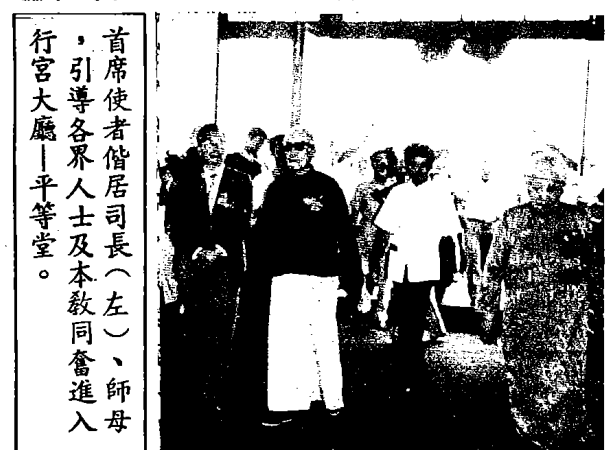
首席使者偕居司長（左）、師母，引導各界人士及本教同奮進入行宮大廳——平等堂。

天極行宮興建在台中縣青雲嶺上，興建工程將近三年，始正式落成。其形勢天成、氣象磅礴，正面俯瞰台灣海峽，遙控大陸神州，為本教最高精神堡壘。所有設計結構，完全與一般寺廟不同，不供奉神像，無神秘氣氛，第一層為平等堂，供大眾瞻仰禮拜，祈禱親和。第二層為大同堂，是本教信徒同奮精神教育傳習場所。第三層為玉靈殿，供天帝駐節、仙佛聖尊雲集之聖壇，並奉 天帝選選世界偉人、中華