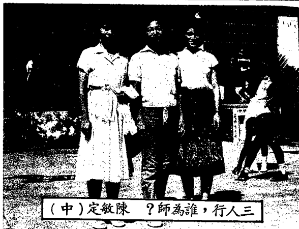
(中)定敏陳 ？師為誰，行人三

結業後迄今四年時間，一直住在教院，以教爲家。歷任右典司務、典司篆之職。目前擔任①道務中心右典司經、正值殿司。②管理中心司供、司庫。③坤院梅莊莊主等。四年來對其有形無形的考驗當然很