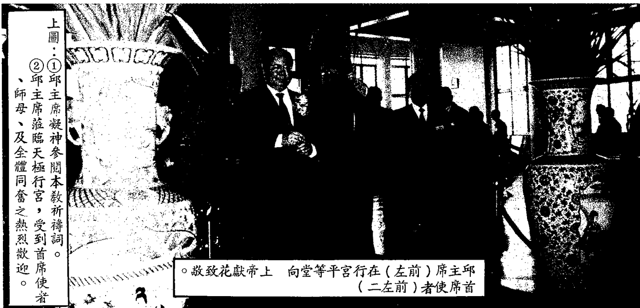
邱主席（左前）向行宮平等堂（左二）師尊及師母（右二）敬獻花籃

首席師尊致詞時指出，凡是靜坐班的同奮（一、十期、坤一、四期、先修一期）在經過百日潛心修持，天上人間的無形精神交感與改造