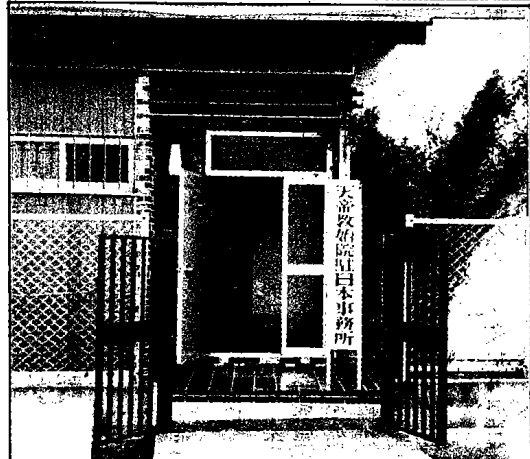
右：事務所正門景觀。