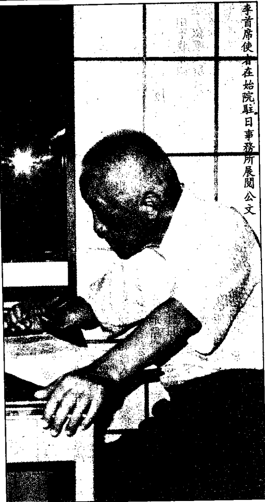
李首席使者在始院駐日事務所展開公文